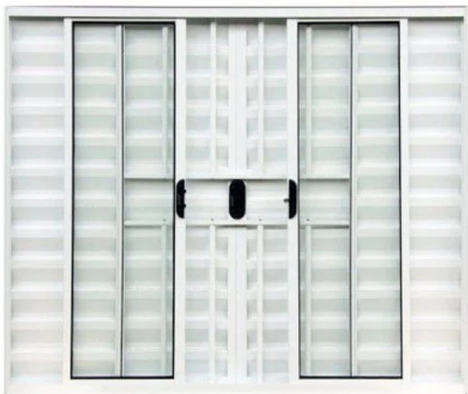
Janela Veneziana 6 Fls Com Grade Alumínio Branco ou Brilhante