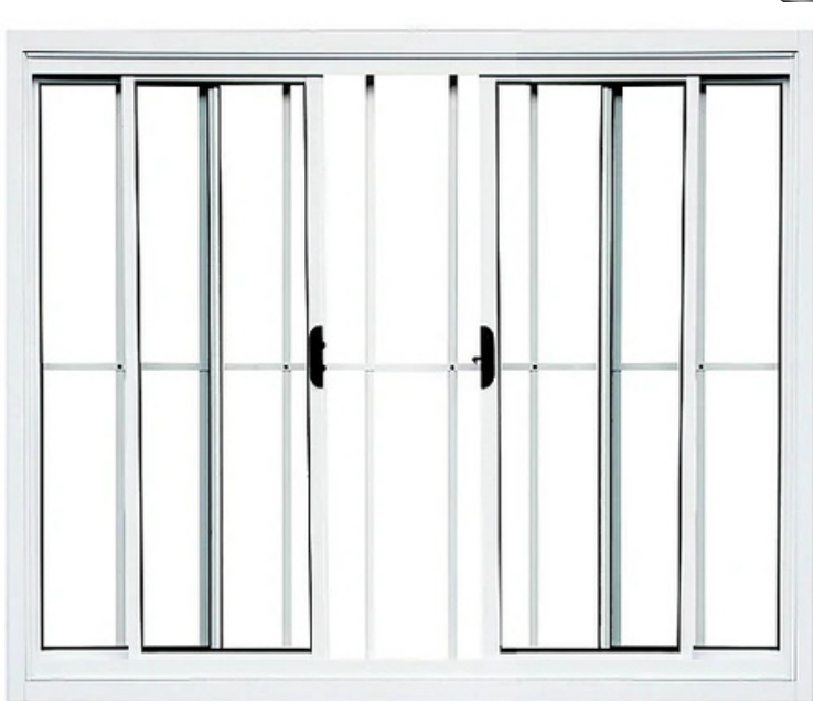
Janela De Correr 4 Fls Com Grade Alumínio Branco ou Brilhante